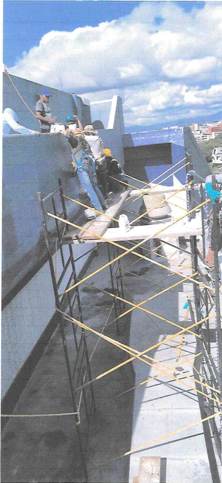
Desinfección y liberación de agregados en la tesela para azul y verde. En la fachada oriente en el sector A4.