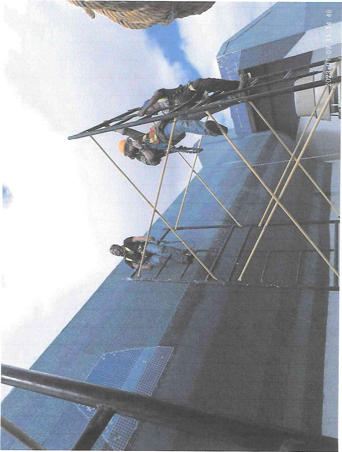
Armado de andamios para llegar a las teselas y bordes para su limpieza en la fachada oriente en el sector A4.