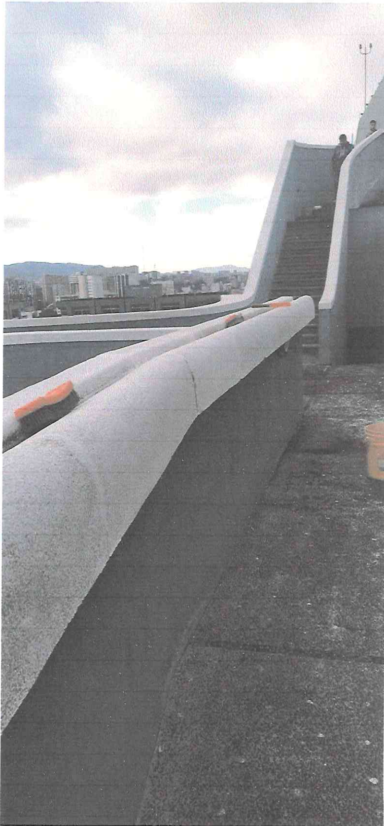
Limpieza de bordes blancos de las barandas en el sector 4 de la fachada oriente.